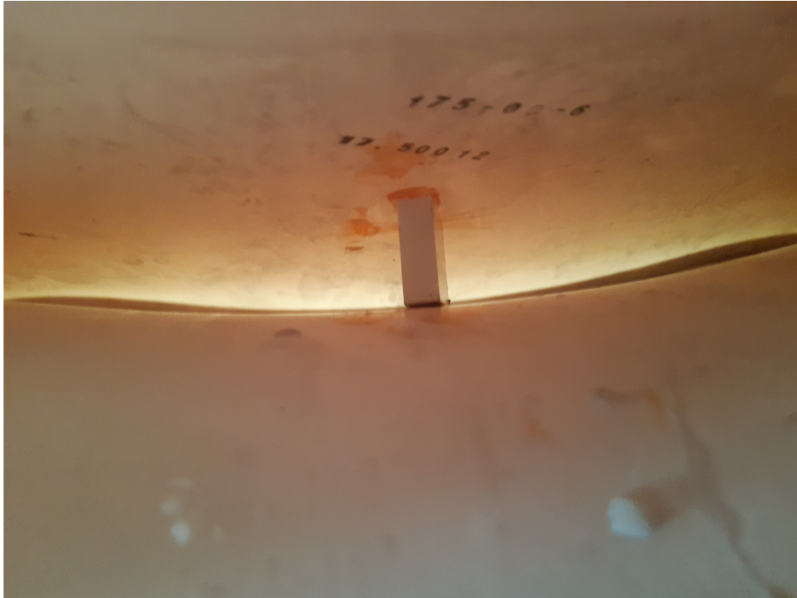
Bild 5: Strebe zwischen eigentlichem Waschbecken und Verkleidungsteil genau an der Stelle zwischen Riß 3 und Riß 4, vermutlich als Reparaturmaßnahme für die Risse 3 und 4 eingesetzt.