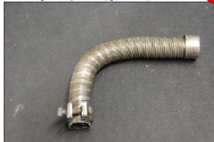
Abb.: Auspuffende mit dem Winkel befestigen