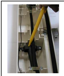
Bild 5a Notkurbel